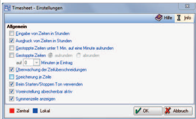
Optionen im Timesheet (Zeithonorar I)

Erfassen Sie den gesamten in der Kanzlei anfallenden Zeit- und damit Arbeitsaufwand zur Akte. Bereits bei der Aktenanlage können Sie jeder Akte einen Stundensatz zuweisen. Änderungen im Rahmen konkreter Zeiterfassung sind anschließend jederzeit problemlos möglich.